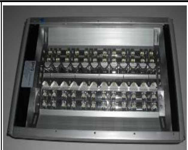
DST-100W LED 路燈